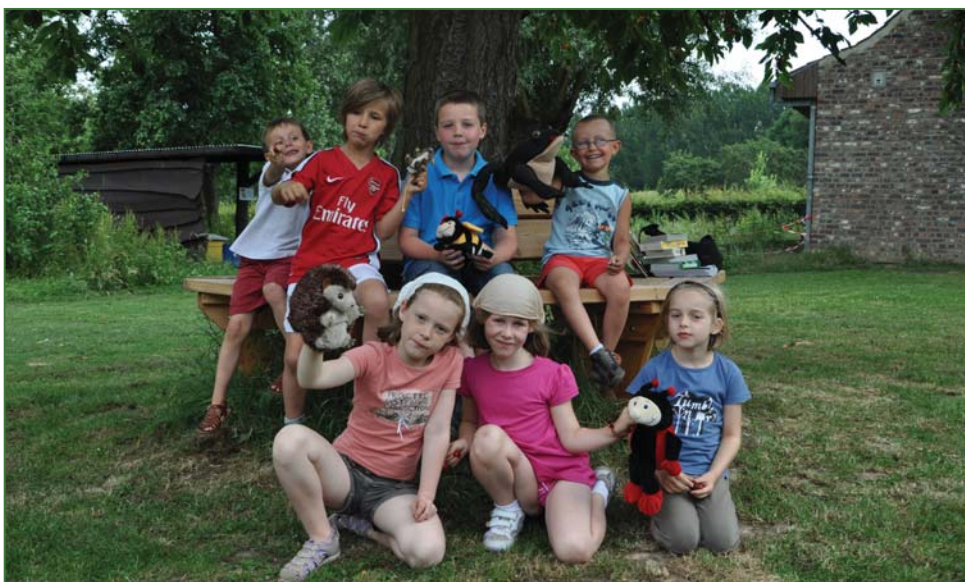
Zomerstage 'Fiets en beleef de natuur'

Het zal je niet ontgaan, beste lezer, dat het aldus functioneren van ons project niet zonder moeite gebeurt. Het onderscheidt zich in weinig of niets van zoveel initiatieven in onze samenleving, die moeten “zaaien naar de zak”. Bijwijlen heb ik daarbij het gevoel “water te scheppen met een mand”. Een “maatje meer aan structurele hulp” zou niet slecht zijn.